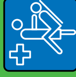
Arzt & Krankenpflege

RISIKO • GEFAHR • RISIKO • RISIKO • GEFAHR • RISIKO • RISIKO • RISIKO • GEFAHR • RISIKO • RISIKO • GEFAHR... ...bei • Blut • Sperma • Scheidenflüssigkeit • Muttermilch