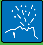
Anhusten & Anniesen