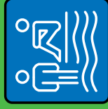
Bad & Sauna