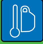
Gemeinsam Essen & Trinken