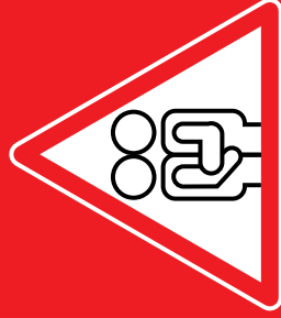
Sex ohne Kondom

RISIKO • GEFAHR • RISIKO • RISIKO • GEFAHR • RISIKO • RISIKO • RISIKO • GEFAHR • RISIKO • RISIKO • GEFAHR... ...bei • Blut • Sperma • Scheidenflüssigkeit • Muttermilch