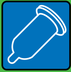
Sex mit Kondom