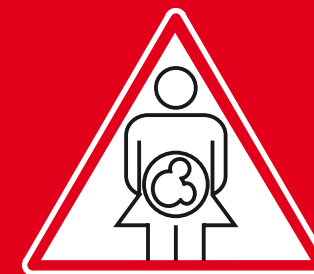
От матери ребёнку (рождение, кормление)