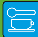
Вместе есть и пить