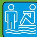
Ванная и сауна