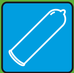
Секс с презервативом