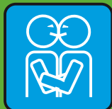
Поцелуи и Объятия