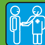
Врач и уход за больными

РИСК · ОПАСНОСТЬ · РИСК · ОПАСНОСТЬ · РИСК... ...у Кровь · Сперма · Выделения · Материнское молоко